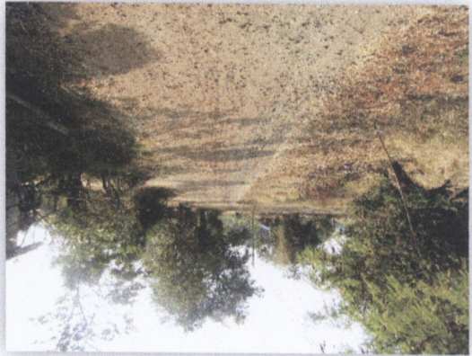
เขื่อนฝายน้ำล้น

๑.๑๒ โครงการก่อสร้างฝายน้ำล้นบริเวณท้ายเขื่อนฝายน้ำล้นบริเวณท้ายเขื่อนฝายน้ำล้น - ๑ ฝายน้ำล้น - ๑ ฝายน้ำล้น