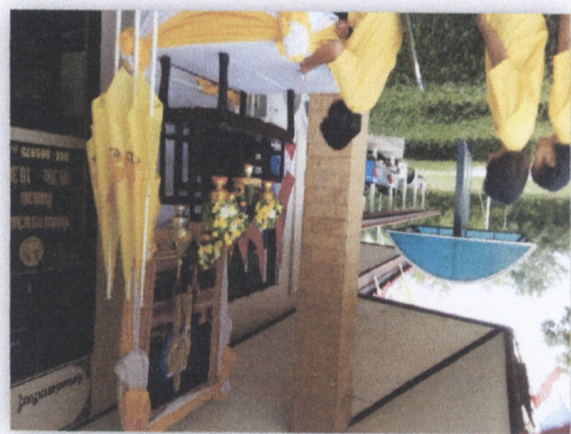
๑๒. โครงการส่งเสริมสุขภาพในสถานศึกษา