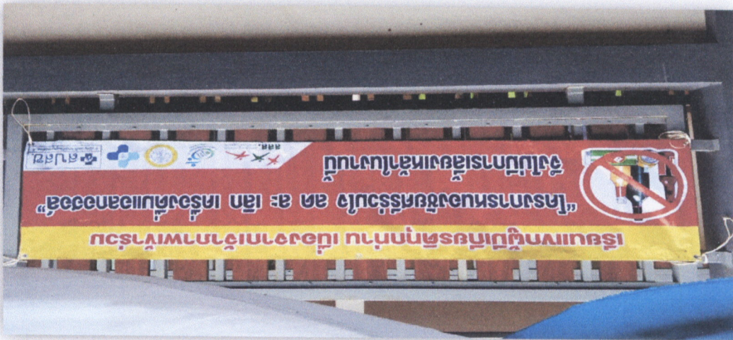
๑๐. โครงการรณรงค์ส่งเสริมสุขภาพในสถานศึกษา