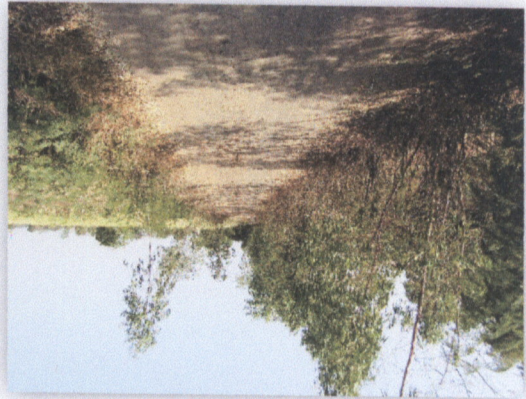
រូបភាពស្រែស្រឡះ

២០ រូបភាព ១២៣៧ - ០១ រូបភាព មន្ទីរពេទ្យ ស្រែស្រឡះ ក្រុងស្រែស្រឡះ ខេត្តស្រែស្រឡះ កម្ពុជា