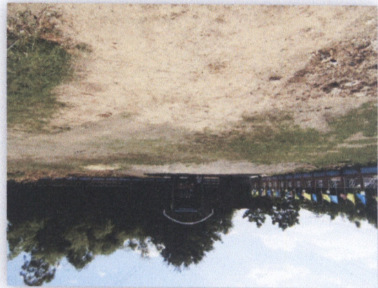
រូបភាពស្ថានភាពស្ថិតិស្ថេរ

៤. គ្រោងស្រាវជ្រាវ ៣ គ្រោង ក្នុងនាមស្ថានភាពស្ថិតិស្ថេរស្រាវជ្រាវ