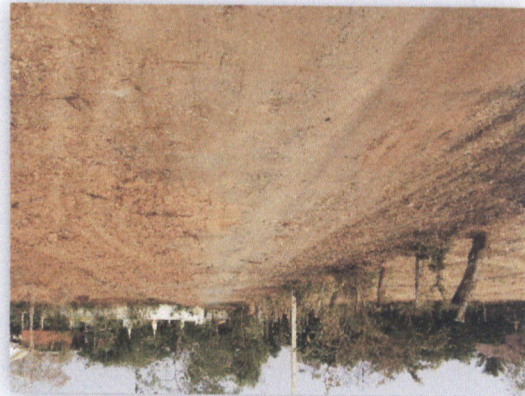
រូបភាពទន្លេចម្រើន

០២ ក្រុមប្រឹក្សាភិបាលក្រសួងកសិកម្ម រុក្ខាប្រមាញ់ និងនេសាទ លេខ ៧២៣ បណ្តាញសេចក្តីសម្រេច ក្រសួងកសិកម្ម រុក្ខាប្រមាញ់ និងនេសាទ