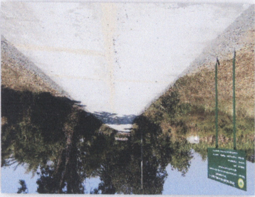
เขื่อนฝายน้ำล้น

๑.๑ โครงการก่อสร้างฝายน้ำล้นบริเวณท้ายเขื่อนฝายน้ำล้นบริเวณท้ายเขื่อนฝายน้ำล้น