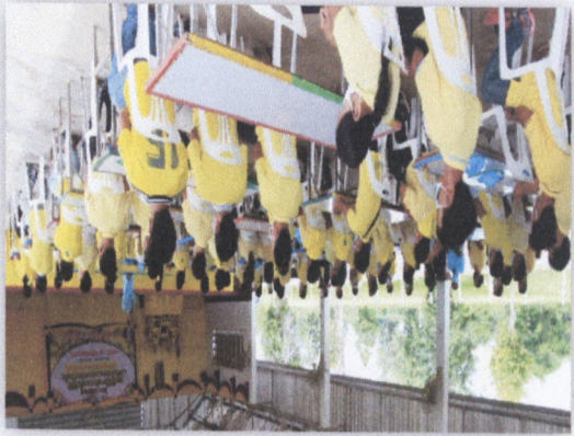
၁၁. အထွေထွေ အစည်းအဝေး