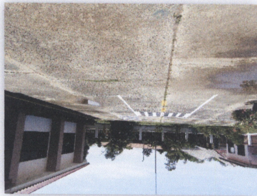
แบบที่ ๒๐