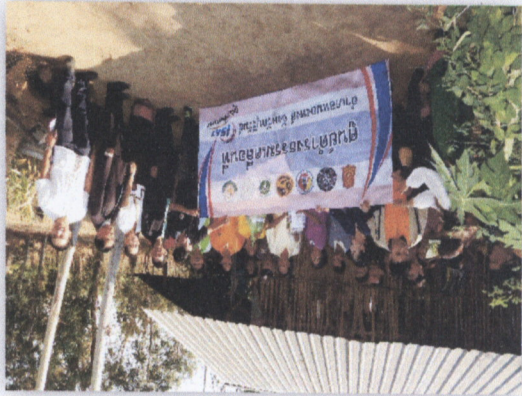
๓๕. โครงการ อบต. สัจใจ (ทำรวม)