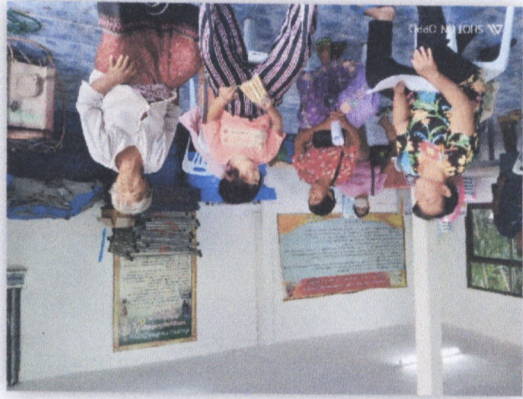
៤៣. ទំនាក់ទំនងបណ្តោះអាសន្ន