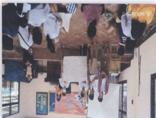
๕๕. โครงการการศึกษาและเล่นกีฬาของโรงเรียนพระเทพมุนีรังษี