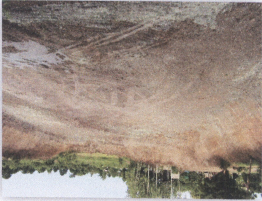
แบบที่ ๑๕