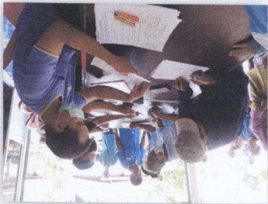
៤៤. ទំនាក់ទំនងបណ្តោះអាសន្ន