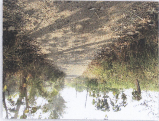
រូបភាពទន្លេចម្រើន

០១ ក្រុមប្រឹក្សាភិបាលក្រសួងកសិកម្ម រុក្ខាប្រមាញ់ និងនេសាទ លេខ ៧២៣ បណ្តាញសេចក្តីសម្រេច ក្រសួងកសិកម្ម រុក្ខាប្រមាញ់ និងនេសាទ