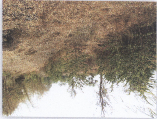
រូបភាពស្ថានភាពស្ថិតិស្ថេរ

២. គ្រោងស្រាវជ្រាវ ១១ គ្រោង ក្នុងនាមស្ថានភាពស្ថិតិស្ថេរស្រាវជ្រាវ