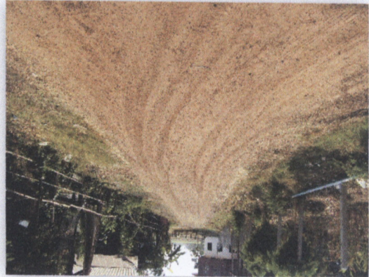
រូបភាពផ្លូវឃុំ

៣១. ភ្នំពេញ - ២.៧ ការសិក្សាស្រាវជ្រាវស្តីពីការអភិវឌ្ឍន៍សេវាសេដ្ឋកិច្ចសម្រាប់ស្ត្រីក្នុងតំបន់ភ្នំពេញ