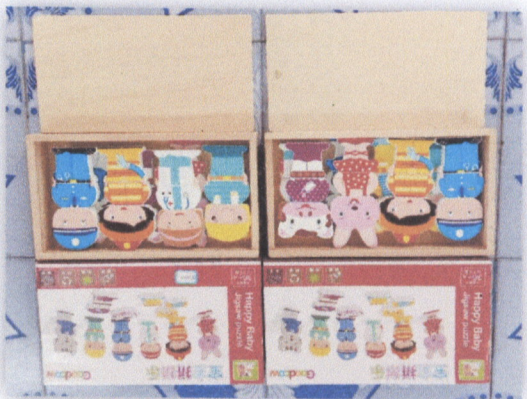
๒๘. โครงการการศึกษาระหว่างการสนทนา