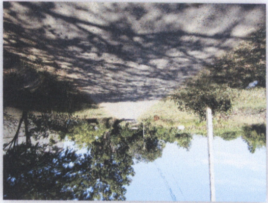
เขื่อนฝายน้ำล้น

๑.๑๑ โครงการก่อสร้างฝายน้ำล้นบริเวณท้ายเขื่อนฝายน้ำล้นบริเวณท้ายเขื่อนฝายน้ำล้น (ข.๑๕๑๑.๓.๑๕๑๑) - ๑ ฝายน้ำล้น - ๑ ฝายน้ำล้น