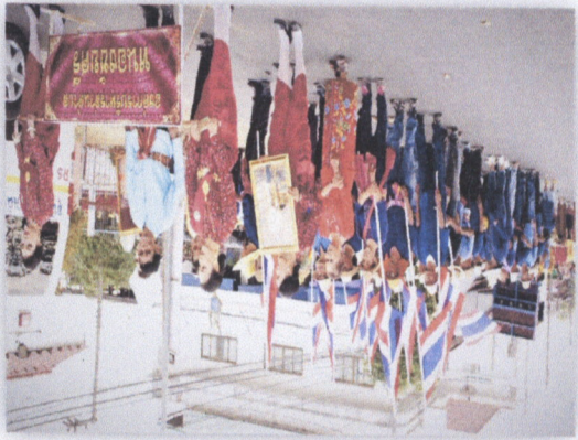
၁၂. အထွေထွေ အစည်းအဝေး