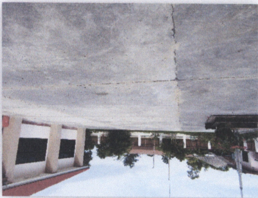
แบบที่ ๑๙