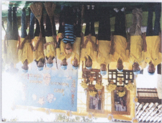
๓๒. โครงการจัดอาสาสมัคร