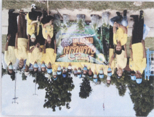
๓๖. โครงการสนับสนุนแม่แห่งชาติ