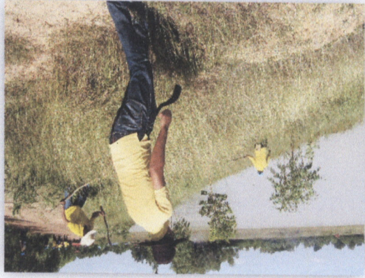
๓๑. โครงการปรับปรุงภูมิทัศน์โรงเรียน