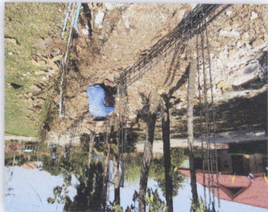
រូបភាពផ្លូវឃុំ

៣២. ភ្នំពេញ - ២.៧ ការសិក្សាស្រាវជ្រាវស្តីពីការអភិវឌ្ឍន៍សេវាសេដ្ឋកិច្ចសម្រាប់ស្ត្រីក្នុងតំបន់ភ្នំពេញ