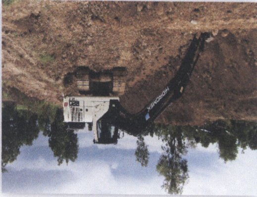
រូបភាពស្ថានភាពស្ថិតិស្ថេរ