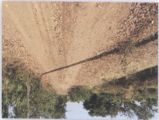
រូបភាពស្រែស្រឡះ

២១ រូបភាព ១២៣៧ - ០២ រូបភាព មន្ទីរពេទ្យ ស្រែស្រឡះ ក្រុងស្រែស្រឡះ ខេត្តស្រែស្រឡះ កម្ពុជា