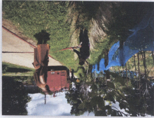
๓๗. โครงการพัฒนาลักษณะสิ่งแวดล้อมภายในหมู่บ้าน