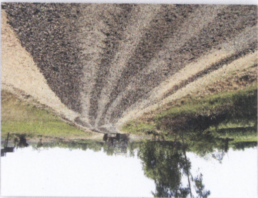
រូបភាពស្រែស្រឡះ

២២ រូបភាព ១២៣៧ - ០៣ រូបភាព មន្ទីរពេទ្យ ស្រែស្រឡះ ក្រុងស្រែស្រឡះ ខេត្តស្រែស្រឡះ កម្ពុជា