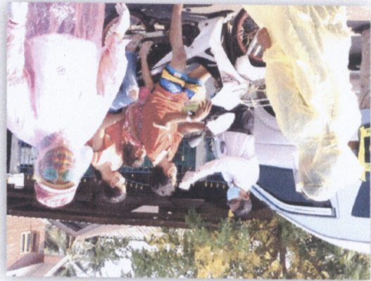
๓๑. หน่วยงานที่เกี่ยวข้องกับงานป้องกันและควบคุมการระบาดของโรคโควิด-๑๙ ในพื้นที่ต่าง ๆ