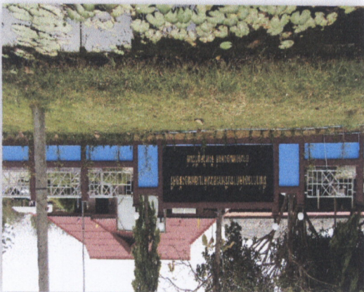
រូបភាពផ្ទះឃុំស្រែ