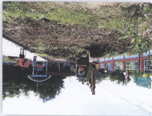
แบบที่ ๑๘