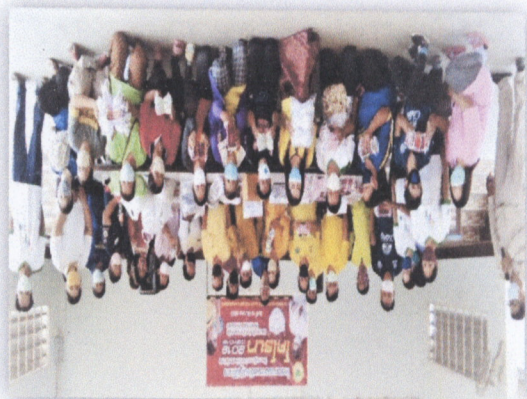
๓๐. โครงการอบรมเชิงปฏิบัติการให้ความรู้ในการป้องกันและควบคุมเชื้อไวรัสโคโรนา 2019 (COVID-19) และการจัดการพื้นที่จากอนามัยเพื่อป้องกันตนเอง