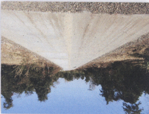
រូបភាពទន្លេចម្រើន

០២ ក្រុមប្រឹក្សាភិបាលក្រសួងកសិកម្ម រុក្ខាប្រមាញ់ និងនេសាទ លេខ ៧២៣ បណ្តាញសេចក្តីសម្រេច ក្រសួងកសិកម្ម រុក្ខាប្រមាញ់ និងនេសាទ