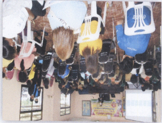
๒๖. กิจกรรมของโครงการในวัยผู้ใหญ่ที่มีส่วนร่วมในพัฒนาครอบครัวและอาสาสมัครแม่บ้านเอื้ออาทร