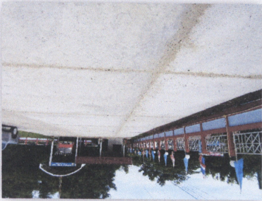
แบบที่ ๑๗