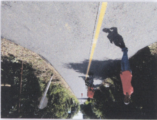
រូបភាពស្ថានភាពស្ថិតិស្ថេរ

២. គ្រោងស្រាវជ្រាវ ១១ គ្រោង ក្នុងនាមស្ថានភាពស្ថិតិស្ថេរស្រាវជ្រាវ