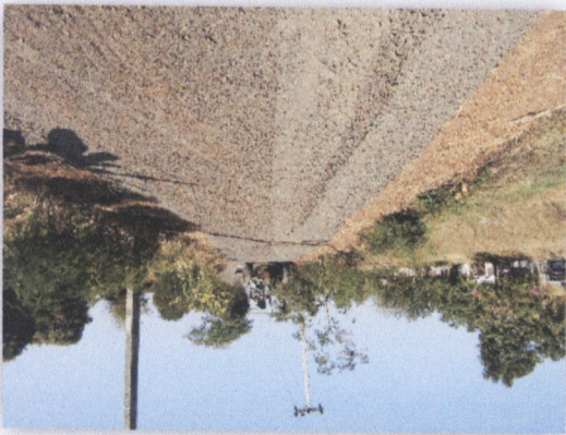
រូបភាពស្រែស្រឡះ

២១ រូបភាព ១២៣៧ - ០២ រូបភាព មន្ទីរពេទ្យ ស្រែស្រឡះ ក្រុងស្រែស្រឡះ ខេត្តស្រែស្រឡះ កម្ពុជា