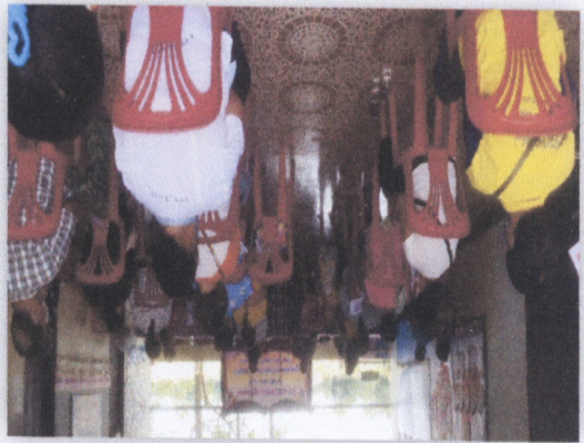
๒๗. กิจกรรมของอาสาสมัครแม่บ้านเอื้ออาทร