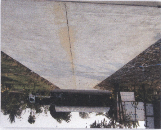
เขื่อนฝายน้ำล้น