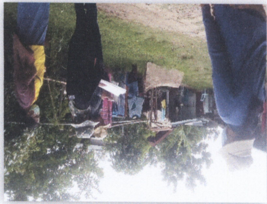
១៧. គម្រោងការងារស្រាវជ្រាវស្តីពីការអភិវឌ្ឍន៍សេដ្ឋកិច្ចកសិកម្ម និងការងារសម្រាប់ប្រជាជនក្រីក្រ