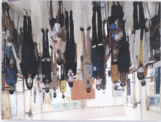
๓๓. โครงการให้ความรู้แก่ประชาชนเกี่ยวกับความสามารถของเจ้าหน้าที่สาธารณสุข