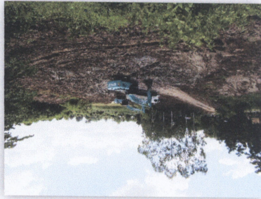
แบบที่ ๑๖