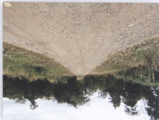
រូបភាពទន្លេចម្រើន

០៣ ក្រុមប្រឹក្សាភិបាលក្រសួងកសិកម្ម រុក្ខាប្រមាញ់ និងនេសាទ លេខ ៧២៣ បណ្តាញសេចក្តីសម្រេច ក្រសួងកសិកម្ម រុក្ខាប្រមាញ់ និងនេសាទ