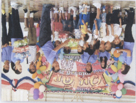
၁၀. အထွေထွေ အစည်းအဝေး