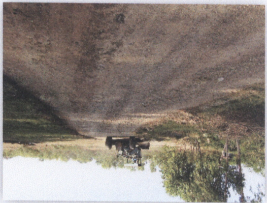
រូបភាពស្រែស្រឡះ

២២ រូបភាព ១២៣៧ - ០៣ រូបភាព មន្ទីរពេទ្យ ស្រែស្រឡះ ក្រុងស្រែស្រឡះ ខេត្តស្រែស្រឡះ កម្ពុជា