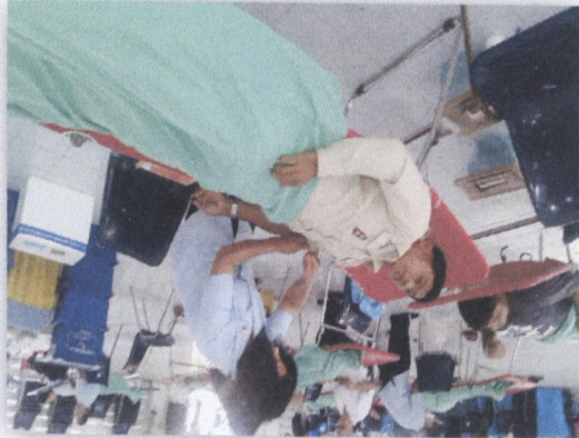
๑๑. คณะผู้บริหารและบุคลากร