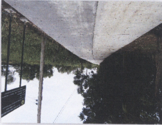
រូបភាពទន្លេចម្រើន