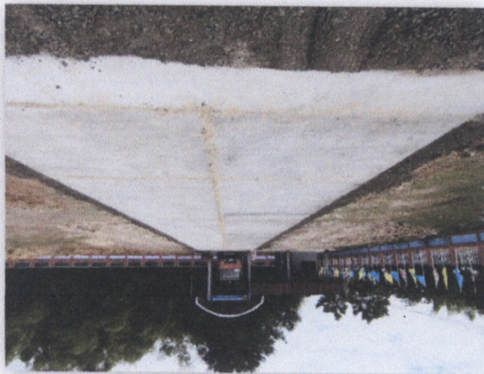
រូបភាពស្ថានភាពស្ថិតិស្ថេរ

៣. គ្រោងស្រាវជ្រាវ - ៣ គ្រោង ក្នុងនាមស្ថានភាពស្ថិតិស្ថេរ ៣០-២០១២: រ.វ. ក្រសួងស្រាវជ្រាវ និងកសិកម្ម រុក្ខាប្រមាញ់ និងនេសាទ ក្រសួងស្រាវជ្រាវ និងកសិកម្ម រុក្ខាប្រមាញ់ និងនេសាទ ក្រសួងស្រាវជ្រាវ និងកសិកម្ម រុក្ខាប្រមាញ់ និងនេសាទ