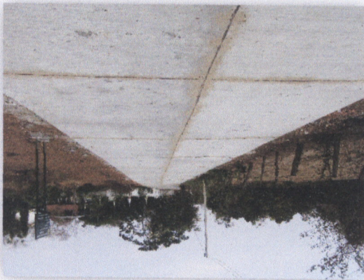
រូបភាពទន្លេចម្រើន

០១ ក្រុមប្រឹក្សាភិបាលក្រសួងកសិកម្ម រុក្ខាប្រមាញ់ និងនេសាទ លេខ ៧២៣ បណ្តាញសេចក្តីសម្រេច ក្រសួងកសិកម្ម រុក្ខាប្រមាញ់ និងនេសាទ