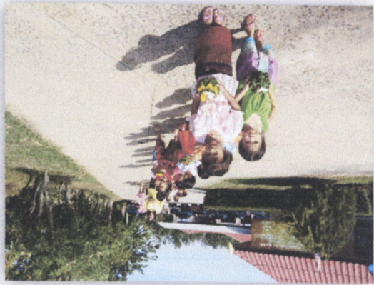
១៦. គម្រោងការងារស្រាវជ្រាវស្តីពីការអភិវឌ្ឍន៍សេដ្ឋកិច្ចកសិកម្ម និងការងារសម្រាប់ប្រជាជនក្រីក្រ