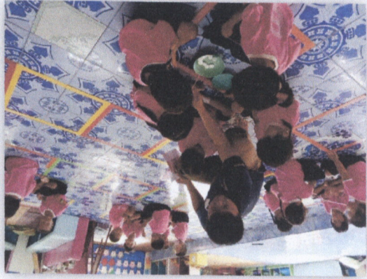
១៥. គម្រោងការងារស្រាវជ្រាវស្តីពីការអភិវឌ្ឍន៍សេដ្ឋកិច្ចកសិកម្ម និងការងារសម្រាប់ប្រជាជនក្រីក្រ (២០១១)