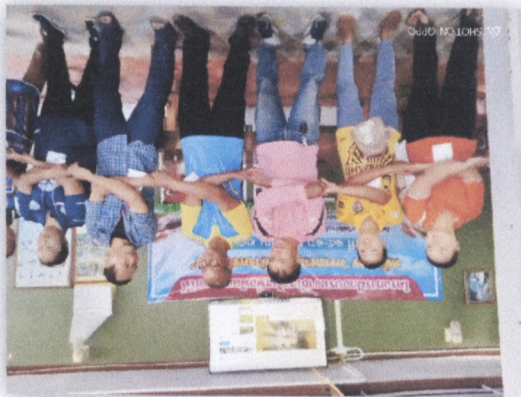
๕๕. โครงการบูรณาการกับโรงเรียนพระเทพมุนีรังษี