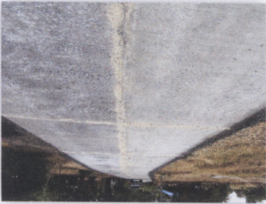
เขื่อนฝายน้ำล้น

๑.๑๑ โครงการก่อสร้างฝายน้ำล้นบริเวณท้ายเขื่อนฝายน้ำล้นบริเวณท้ายเขื่อนฝายน้ำล้น (ข.๑๕๑๑.๓.๑๕๑๑) - ๑ ฝายน้ำล้น - ๑ ฝายน้ำล้น