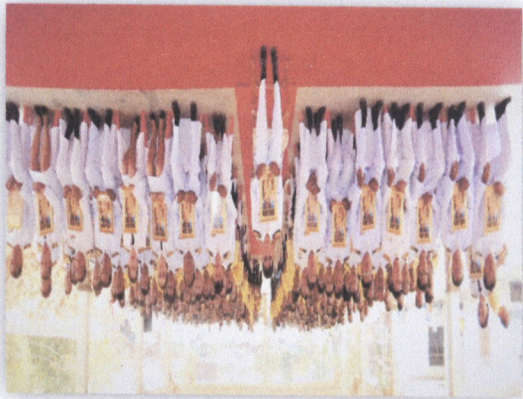
៤៥. គ្រប់គ្រងការងារប្រចាំថ្ងៃ