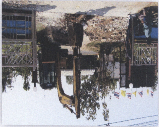
เขื่อนฝายน้ำล้น

๑.๑ โครงการก่อสร้างฝายน้ำล้นบริเวณท้ายเขื่อนฝายน้ำล้นบริเวณท้ายเขื่อนฝายน้ำล้น