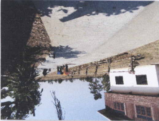
រូបភាពផ្ទះឃុំស្រែ