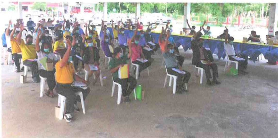
มติประชาคมเห็นชอบโครงการตามร่างแผนพัฒนาท้องถิ่น (พ.ศ. ๒๕๖๖ - ๒๕๗๐)