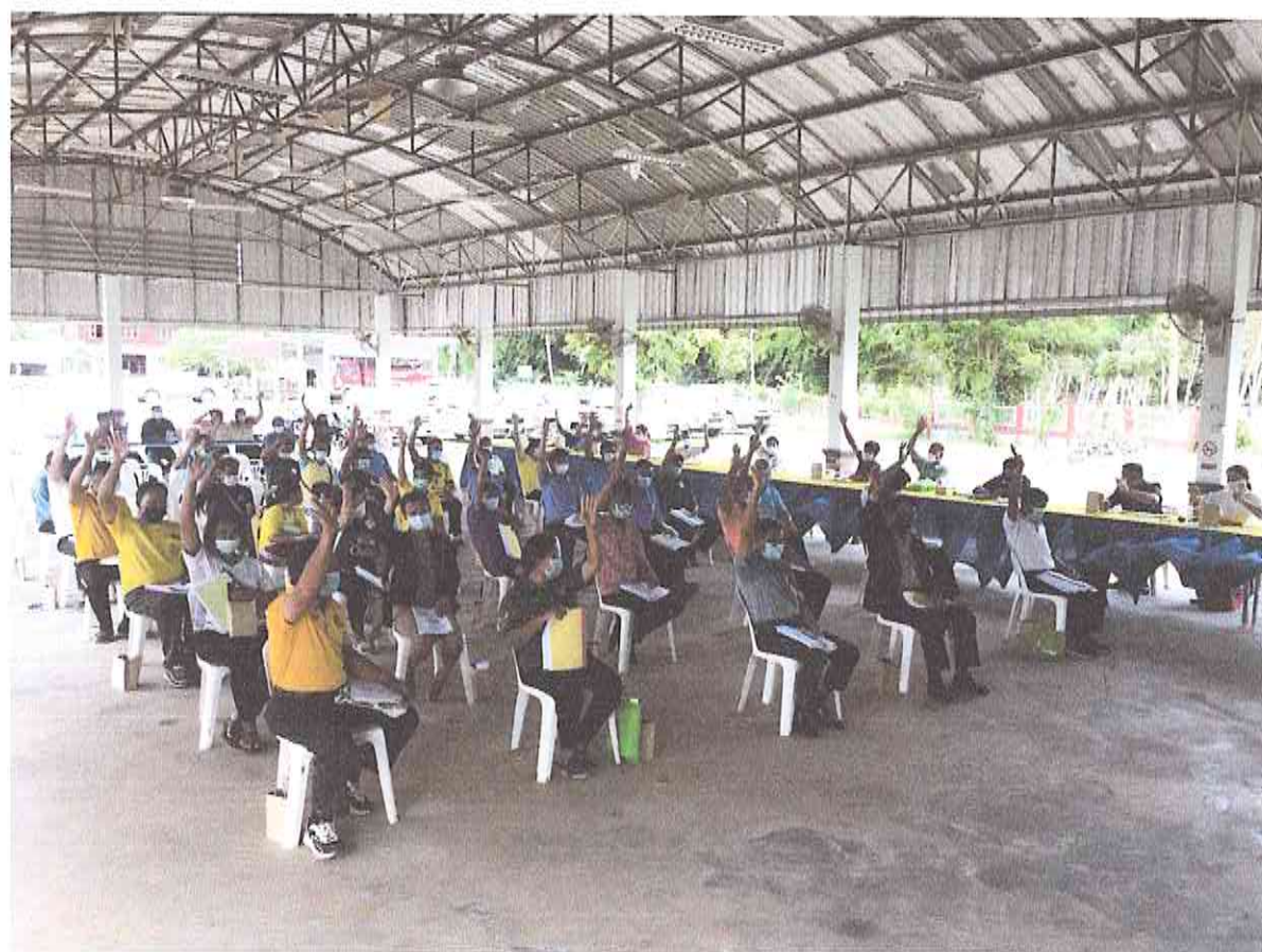
มติประชาคมเห็นชอบโครงการตามร่างแผนพัฒนาท้องถิ่น (พ.ศ. ๒๕๖๖ - ๒๕๗๐)