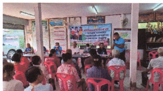
แต่งตั้งคณะกรรมการและคณะทำงานฝ่ายต่าง