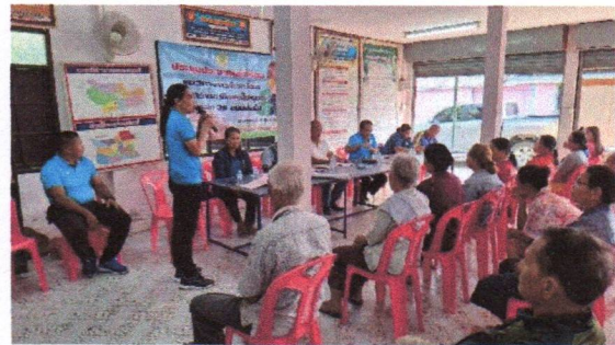
ชี้แจงรายละเอียดโครงการและประโยชน์ที่คาดว่าจะได้รับ