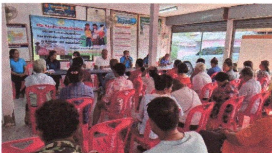
เสนอแนะแลกเปลี่ยนความคิดเห็น